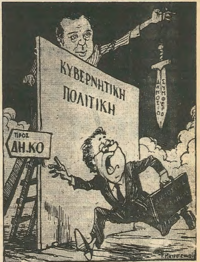
Η ΠΡΟΕΔΡΙΚΗ ΕΓΚΥΚΛΙΟΣ ΠΡΟΣ ΤΟΥΣ ΔΗΜΟΣ. ΥΠΑΛΛΗΛΟΥΣ Από τη ΣΑΤΙΡΙΚΗ

Η ευθύνη της ηγεσίας του ΑΚΕΛ που όχι μόνο δεν πολεμά αλλά υποστηρίζει αυτή την επίθεση ενάντια στις λίγες ελευθερίες που παρέχει η αστική δημοκρατία είναι μεγάλες κι ασυγχώρητες. Αυτοί που υποφέρουν περισσότερο από όλους από την πολιτική της δεξιάς κυβέρνησης ενάντια στους κρατικούς υπαλλήλους ΕΙΝΑΙ ΤΑ ΜΕΛΗ ΚΑΙ ΟΙ ΥΠΟΣΤΗΡΙΧΤΕΣ του ΑΚΕΛ. Αυτό το γνωρίζει και ο τελευταίος κύπριος ενώ οι Ακελικοί έχουν πικρή πείρα για τις διακρίσεις σε βάρος τους στις προσλήψεις, τις προαγωγές και